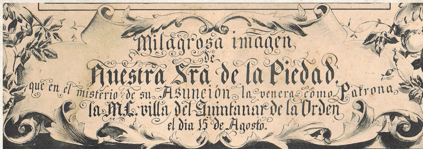
Figura 3.- Pie de una estampa grabada, S. XIX

blaciones vecinas como Villanueva de Alcardete, Corral de Almaguer, Los Hinojosos, Socuéllamos, Villamayor de Santiago, Cabezasada, El Toboso, Miguel Esteban, Villa de don Fadrique o la Puebla de Almoradiel. Todas ellas pertenecientes al Priorato de Uclés, cabeza castellana de la Orden Militar de Santiago (Figs. 1 y 2)