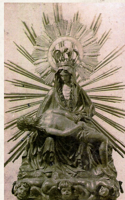
Figura 2.- Virgen de la Piedad, Villanueva de Alcardete. s. XV (?).