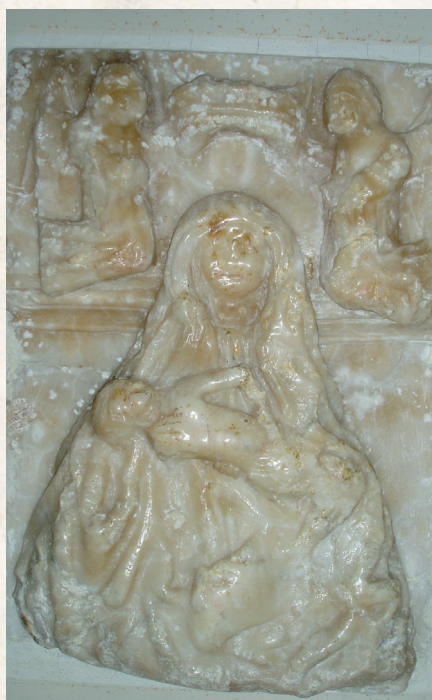
Figura 1.- Relieve de alabastro de la Piedad sito en la ermita de Nª Sª de la Muela de Corral de Almaguer, s. XV-XVI.

Conviene recordar en este punto que 1363 es el año en que según la tradición local se halla milagrosamente la imagen de la “Virgen de la Piedad”. En opinión de varios historiadores, la primitiva representación a la que los quintanareños consideraron su patrona se correspondía con el tipo pasionista (Virgen con el Hijo muerto) referenciado en líneas anteriores. En idéntica forma, y en las fechas aproximadas será venerada en po-