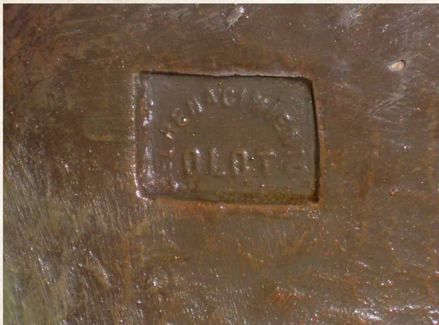
Figura 4.- Sello de fabricación de la imagen