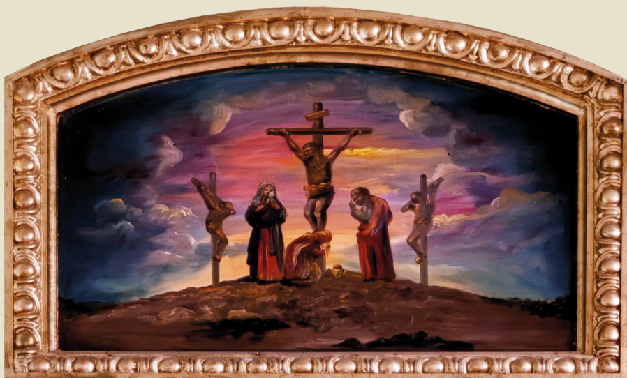
Calvario. Anónimo, S.D. Ermita de Nuestra Señora de la Piedad.

"También afirman que la imagen del Santísimo Cristo de Gracia, que se venera en la ermita de la Piedad, y cuya fiesta se hace el 25 de Septiembre, y la campana de la doctrina, que hay en la torre de la parroquia, provienen de la antigua iglesia del pueblo de Valle-hermoso, hoy despoblado como queda expuesto..."